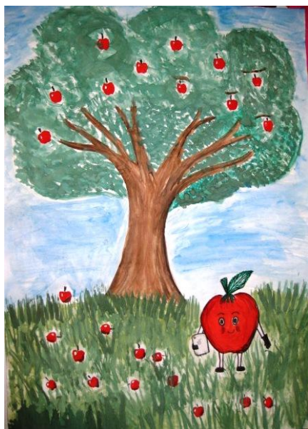
“Продвинутые яблоки” рис. Клинковой Гузель 3-й отряд