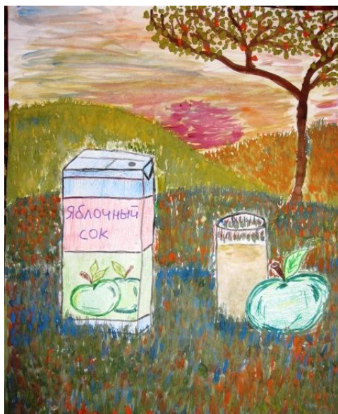
“Яблочный сок”. рис. Якубовой Адели 3-й отряд